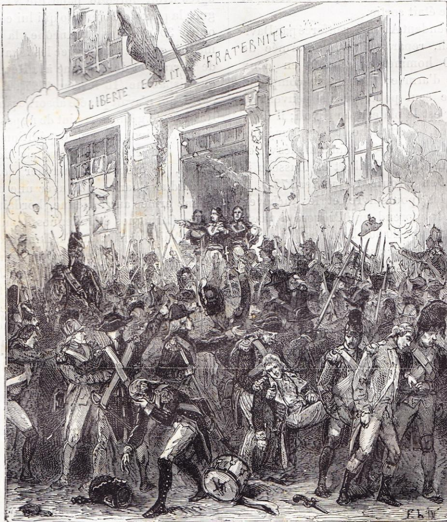
Journée du 13 vendémiaire.

C'est alors que l'Autriche put envoyer une quatrième armée en Italie ; Alvinzi y arriva avec 60 000 hommes. Bonaparte semblait perdu, toute la Pé-